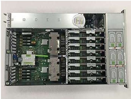
Foto Parte Superior Interna